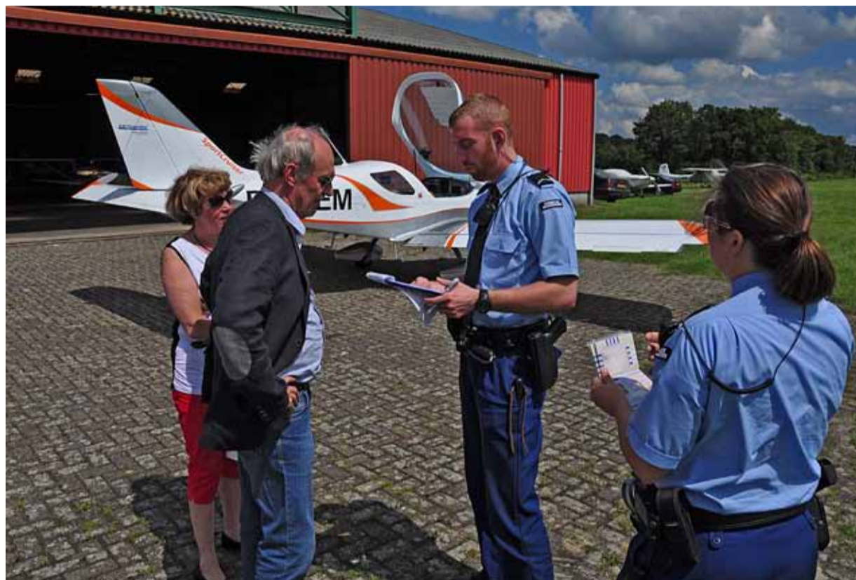
De eigenaars van het sportvliegtuigje op de achtergrond keken enigszins verbaasd op toen zij door twee marechaussees werden opgewacht.

BOSSCHENHOOFD Op Schiphol ontsnappen reizigers nauwelijks aan de aandacht van de marechaussee. Maar wie via de kleinere vliegvelden in Nederland van en aan boord stapt vaak wel. Om toch inzicht te krijgen in deze passagiersstroom werkt het Back Office General Aviation van de marechaussee sinds kort nauw samen met de luchtmacht.