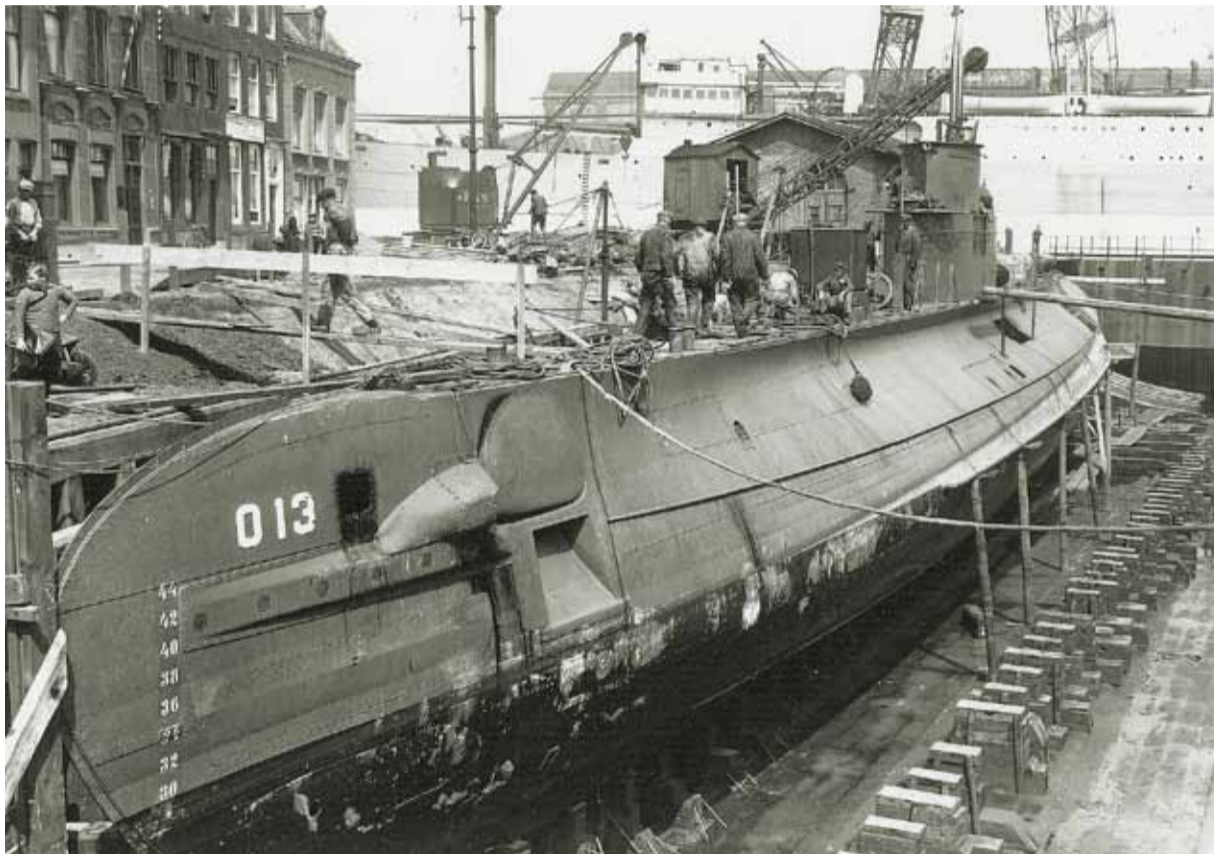
Hr.Ms. O 13 in Vlissingen in afbouw bij de Koninklijke Maatschappij De Schelde.

DEN HELDER Op een mijn gelopen, getorpedeerd, een aanvaring of toch een technisch mankement? Het lot van Hr.Ms. O 13 is ruim zeventig jaar na haar vermissing nog altijd onduidelijk. De Koninklijke Marine zet na zeven decennia een eindsprint in om alsnog het oorlogsgraf van de onderzeebootbemanning te lokaliseren. “De bemanning verdient een bekende, laatste rustplaats.”