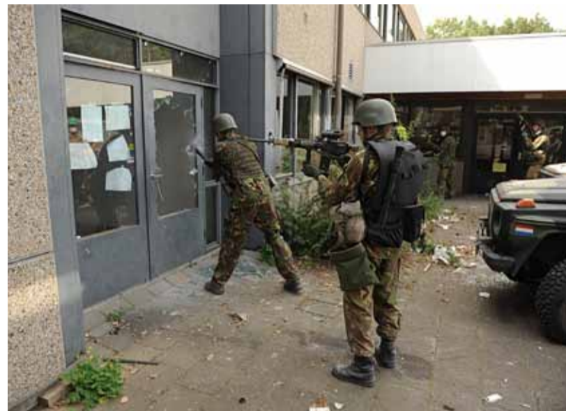
Links De inzet van de luchtmobiele genisten kon op de nodige aandacht rekenen van omwonenden. Rechts De militairen van de landmacht gaven graag uitleg over hetgeen ze beoefenden, het zogenaamde breachen .