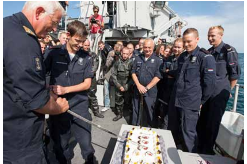
Links Met een ietwat rommelige plof ging het duizendste explosief de lucht in. Rechts Na afloop van de duizendste plof werd met taart op gepaste wijze stilgestaan bij de bereikte mijlpaal.

DEN HELDER Onder grote belangstelling is vorige week vanaf Hr.Ms. Willemstad op de Noordzee het duizendste explosief vernietigd. Dit gebeurde in het kader van de Operatie Beneficial Cooperation . Aan boord van de Nederlandse mijnenjager werd na afloop op gepaste wijze stilgestaan bij dit bijzondere moment.